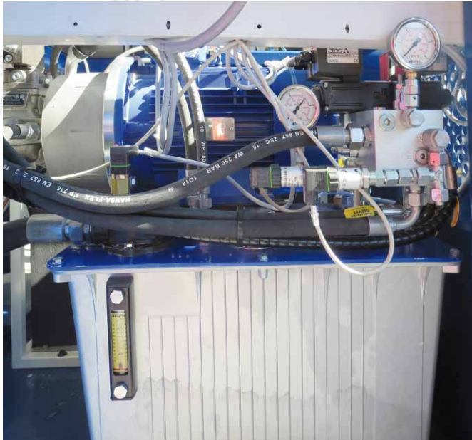
Das neue, leistungsstärkere Hydraulik-Aggregat ist in die Maschine integriert.