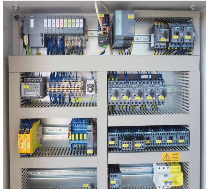
Einblick in die Steuerung